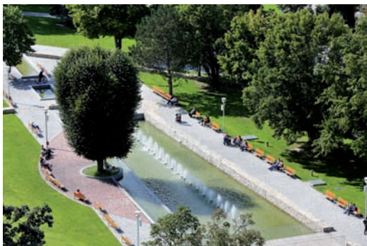
Promenádný park – príjemná zóna oddychu v centre mesta.