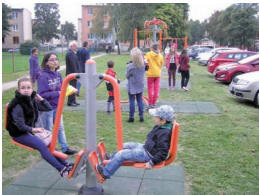
Revitalizácia mestského areálu oddychu pri Topli.