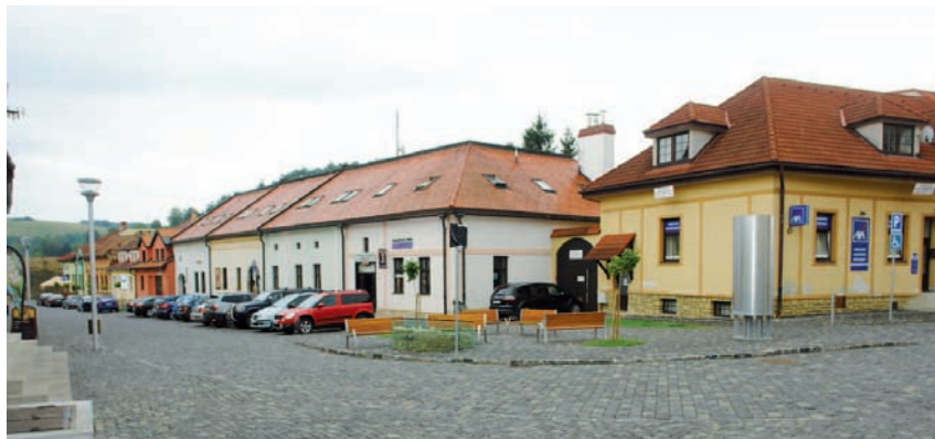
Zrekonštruovaná Stöcklova ulica.