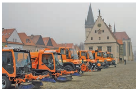
Nová upratovacia a čistiaca technika za vyše 1,9 mil. eur pre potreby nášho mesta.