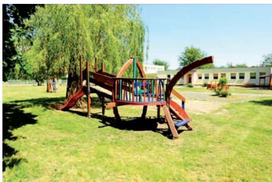
Zrevitalizovaný školský dvor MŠ na Nábrežnej ulici.