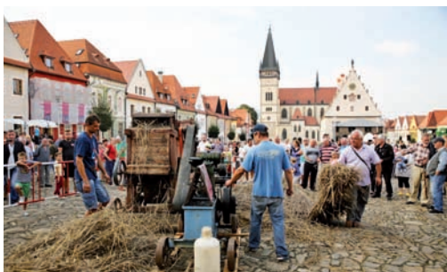
Bardejovské dožinky 2014.