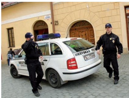
Mestskí policajti v hliadkovej službe.

Veľký dôraz sa kládol na preventívnu činnosť, ktorá sa odvíjala od Programu prevencie kriminality mesta Bardejov na obdobie rokov 2010 – 2015 a pozostávala: z preventívnych programov „Správame sa normálne – miesto drogy športujeme“, „Šikana medzi žiakmi“, „Syndróm CAN“, preventívno-bezpečnostných akcií „Záškoláctvo“, „Vandalizmus“, „Bezpečne pri školách“, „Si mladý, neumieraj zbytočne“ a z Dňa otvorených dverí „Ukážme sa deťom“.