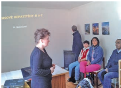
Osveta pre rómskych spoluobčanov.