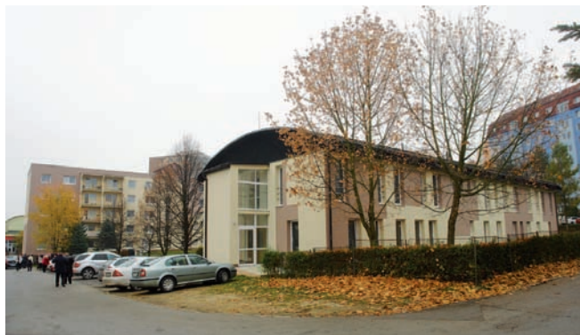
Účelová prístavba k Zariadeniu pre seniorov Čergov.