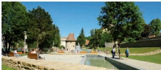
Promenádný park a časť mestského opevnenia pri ňom.