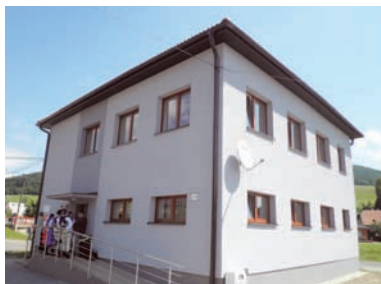
Zrekonštruované Denné centrá v Bardejovskej Novej Vsi (vľavo) a Dlhej Lúke.