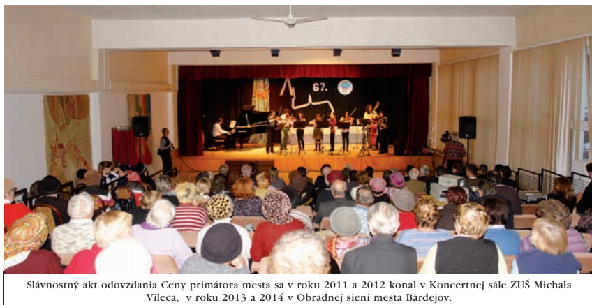
Slávnostný akt odovzdania Ceny primátora mesta sa v roku 2011 a 2012 konal v Koncertnej sále ZUŠ Michala Vileca, v roku 2013 a 2014 v Obradnej sieni mesta Bardejov.

Ocenenie odovzdané 8.12.2012 jeho manželke na Makovickej strune.