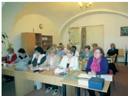
Vzdelávanie v rámci projektu Aktívni seniori.