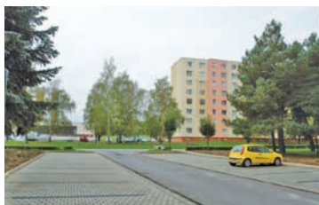
Aj sídliská sa funkčne vynovili.