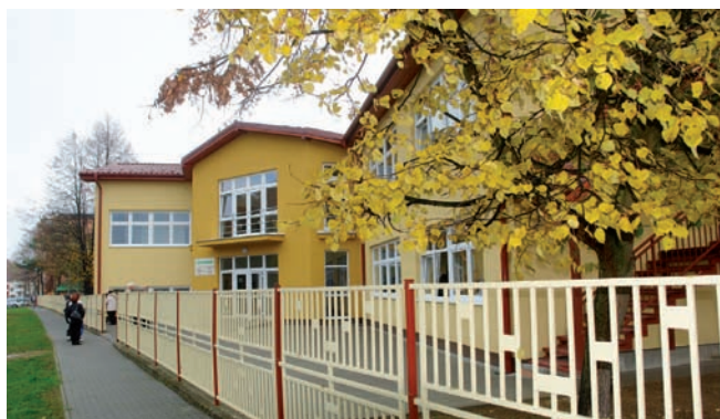
Seniorcentrum na Toplianskej ulici.