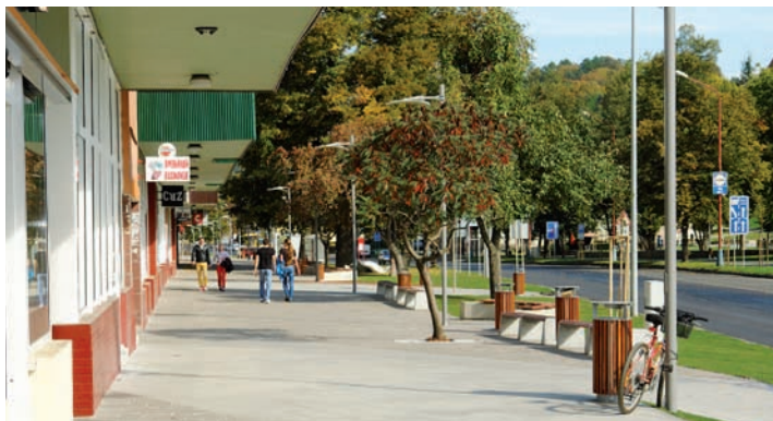
Zrekonštruovaný chodník na Dlhom rade.