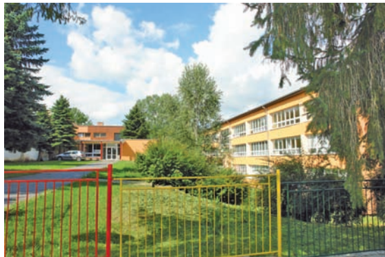
ZŠ na Wolkerovej ulici po modernizácii.