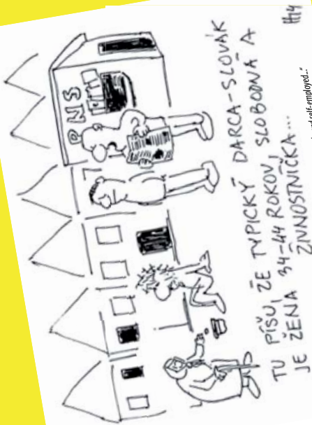
„They say that a typical Slovak donor is a woman of 34-44 years, single and self-employed...“

Apart from providing support to Bardejov activists in our six grant programs and raising funds to finance these programs, we help the local community by means of our operational public-benefit oriented projects. We work with young people and train them in the field of voluntary engagement, philanthropy, grant program management and a number of additional skills needed for management of non-profit organizations. During the last three years, we have closely communicated and collaborated with active local non-profit, local government and informal active groups to identify issues and needs in our town. We have used the results of this research to better target our grant programs and operational projects.